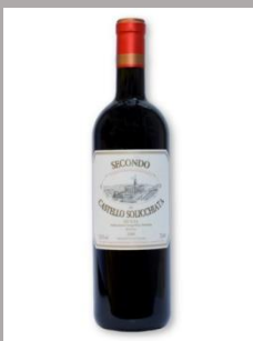
Secondo di Castello Solicchiata