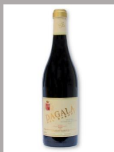
Dagala del Barone